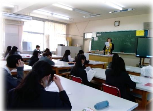
澤先生の模範を聞いています

保育園実習のとき、上手に絵本が読めるように、これから頑張って練習をしようと思います。