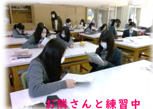
お隣さんと練習中