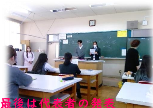
最後は代表者の発表 拍手喝采がおこりました。